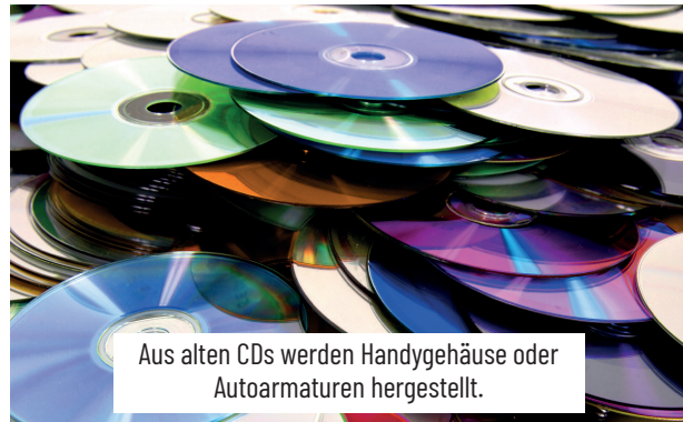
Aus alten CDs werden Handygehäuse oder Autoarmaturen hergestellt.