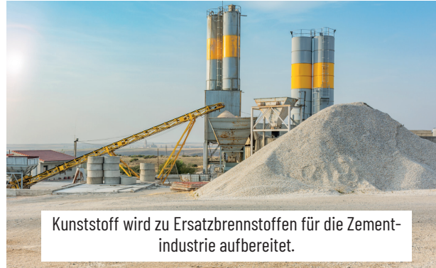
Kunststoff wird zu Ersatzbrennstoffen für die Zementindustrie aufbereitet.