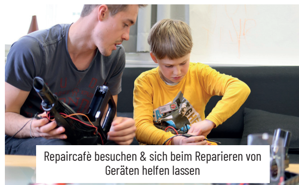
Repaircafé besuchen & sich beim Reparieren von Geräten helfen lassen