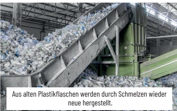
Aus alten Plastikflaschen werden durch Schmelzen wieder neue hergestellt.