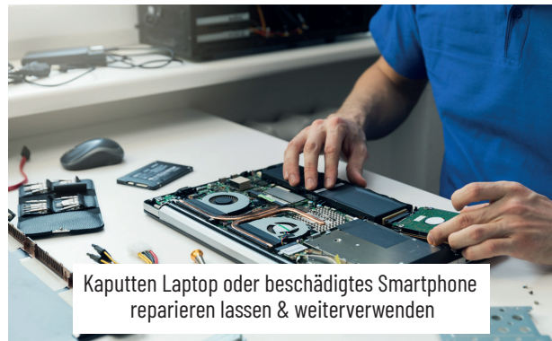
Kaputten Laptop oder beschädigtes Smartphone reparieren lassen & weiterverwenden