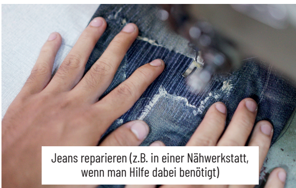
Jeans reparieren (z.B. in einer Nähwerkstatt, wenn man Hilfe dabei benötigt)