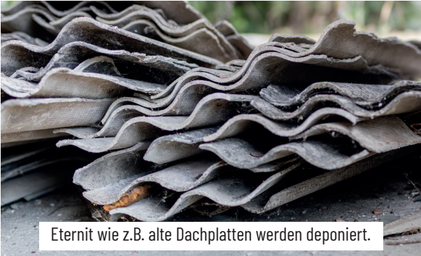
Eternit wie z.B. alte Dachplatten werden deponiert.