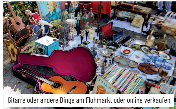
Gitarre oder andere Dinge am Flohmarkt oder online verkaufen