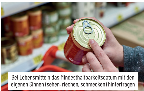
Bei Lebensmitteln das Mindesthaltbarkeitsdatum mit den eigenen Sinnen (sehen, riechen, schmecken) hinterfragen