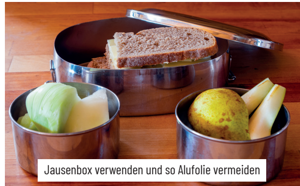
Jausenbox verwenden und so Alufolie vermeiden