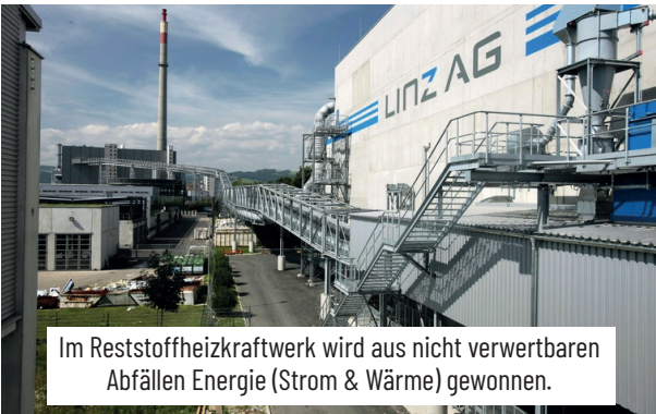
Im Reststoffheizkraftwerk wird aus nicht verwertbaren Abfällen Energie (Strom & Wärme) gewonnen.