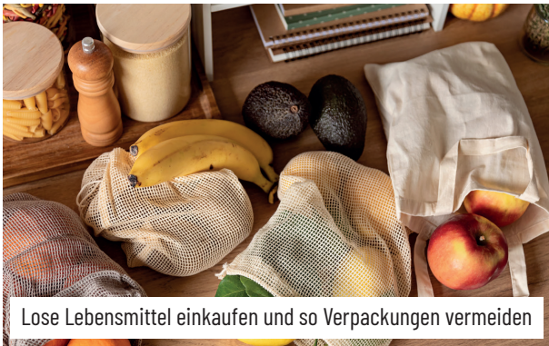
Lose Lebensmittel einkaufen und so Verpackungen vermeiden