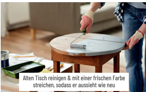
Alten Tisch reinigen & mit einer frischen Farbe streichen, sodass er aussieht wie neu