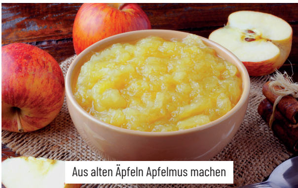
Aus alten Äpfeln Apfelmus machen