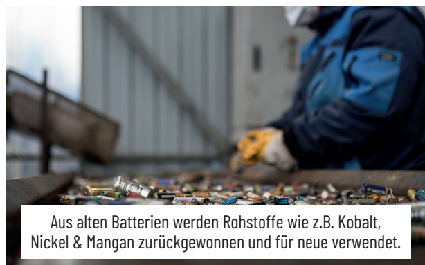
Aus alten Batterien werden Rohstoffe wie z.B. Kobalt, Nickel & Mangan zurückgewonnen und für neue verwendet.