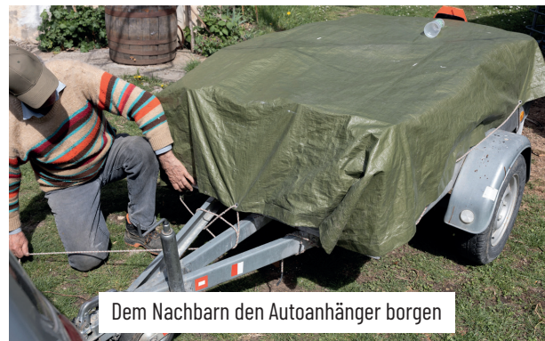
Dem Nachbarn den Autoanhänger borgen