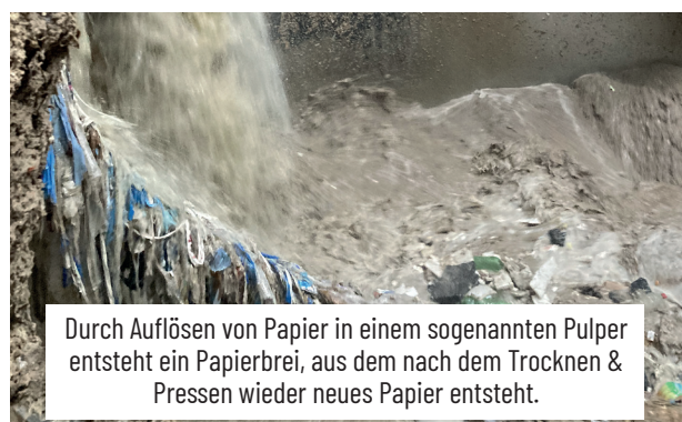
Durch Auflösen von Papier in einem sogenannten Pulper entsteht ein Papierbrei, aus dem nach dem Trocknen & Pressen wieder neues Papier entsteht.