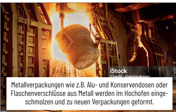
Metallverpackungen wie z.B. Alu- und Konservendosen oder Flaschenverschlüsse aus Metall werden im Hochofen eingeschmolzen und zu neuen Verpackungen geformt.