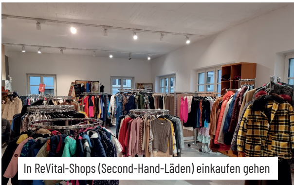
In ReVital-Shops (Second-Hand-Läden) einkaufen gehen